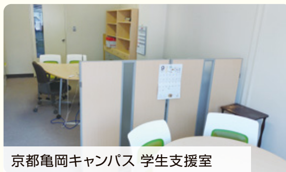
京都亀岡キャンパス 学生支援室