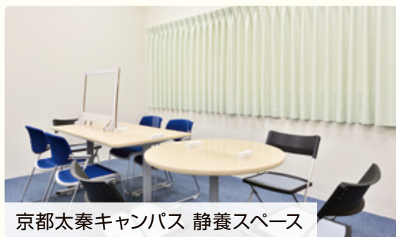
京都太秦キャンパス 静養スペース

主に講義や実習等の修学に困難を抱える学生に対し、保健室、学生相談室、関係する教職員等の各部門と連携、協議し、合理的配慮の提供にかかる支援を行っています。