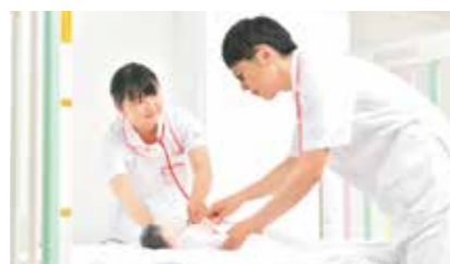
小児のバイタルサイン測定演習

乳幼児ベッドや保育器、また沐浴槽などを備えた実習室。発達段階に応じた多彩な実習モデル人形を利用し、胎児のモニタリングなどさまざまなシミュレーションに取り組むことができます。