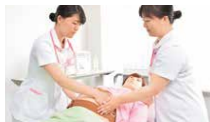
胎児のモニタリング演習

乳幼児ベッドや保育器、また沐浴槽などを備えた実習室。発達段階に応じた多彩な実習モデル人形を利用し、胎児のモニタリングなどさまざまなシミュレーションに取り組むことができます。